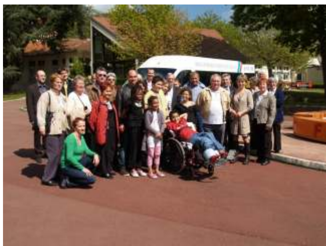
Les amis du HPR lors de la remise du petit bus le 30 avril 2009