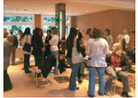
Moment de détente !

Afin d'améliorer son dispositif d'accueil et d'intégration des nouveaux agents, l'Hôpital de Pédiatrie et de Rééducation a mis en place une journée d'accueil pour ses nouveaux personnels.